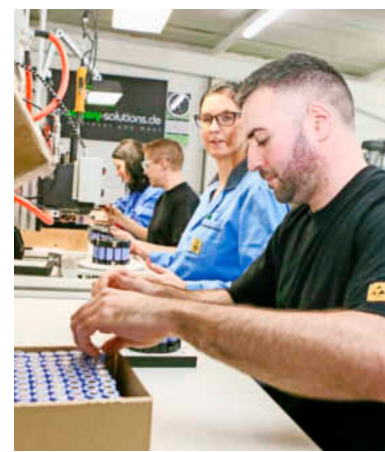
Akkufertigung bei Smart Battery Solutions in Kleinostheim.

»Es geht viel öfter, als man denkt«, betont Arbeitsagentur-Leiter Harald Maidhof, »man muss es einfach mal ausprobieren.« Bei